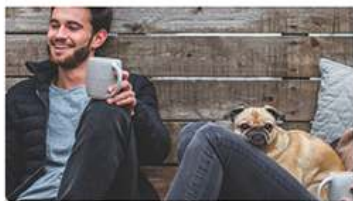
Work - life balance