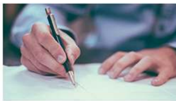
Zawieranie i rozwiązywanie umów o pracę