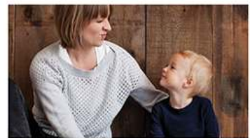
Praca a rodzicielstwo